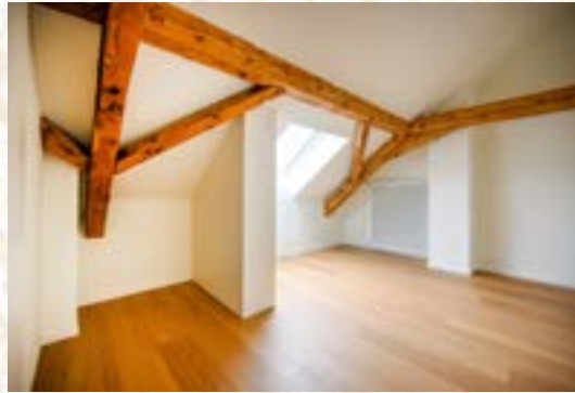
Ausbau Dachgeschoss Maisonettewohnung, vorher und nachher