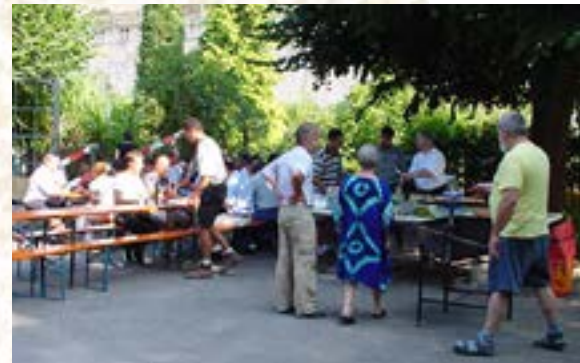
Baufest, geselliges Beisammensein mit dem Vorstand WG Im Heimat- land