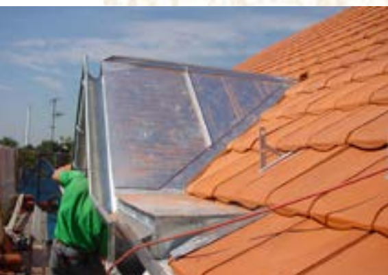
Das neue Blech- Dächli