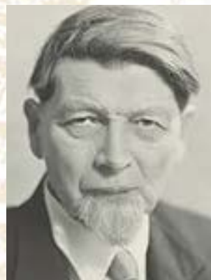
Hans Bernoulli, 1876–1959

Um eine grosse Wirtschaftlichkeit zu erreichen, wurden als Konstruktion Backsteinmauern und Holzbalkendecken gewählt. Für die ganze Bebauung sind die Fenster genormt worden (was damals eine Pionierleistung war), und vom dreiteiligen Fenster wurde möglichst viel Gebrauch gemacht. Die Fassaden der meisten Häuser erhielten einen Jurasitverputz, nur die Aussenmauern der Bauten «Im Vogelsang» und «Hirzbrunnenpark» wurden in Sichtbackstein erstellt. Die Fassaden der einzelnen Häuser weisen eine einfache Gliederung auf, und auch die gut proportionierten Häuserzeilen wirken schlicht.