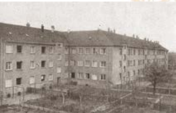
Ansicht Fassade der Häuser hofseitig, Richtung Westen, 1937