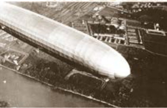
Zeppelin über dem nun bebauten Hirzbrunnengut, 1927