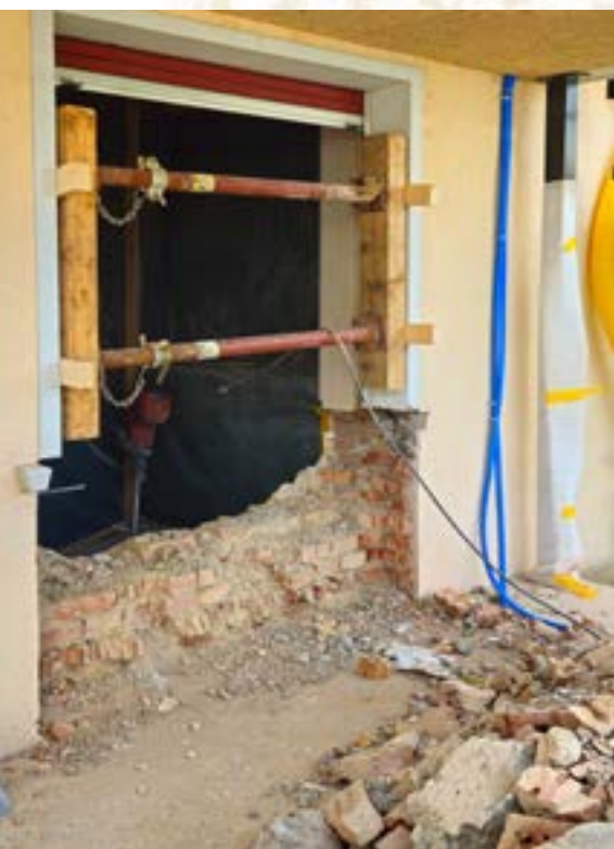
Abbrucharbeiten Terrassenaus- gänge