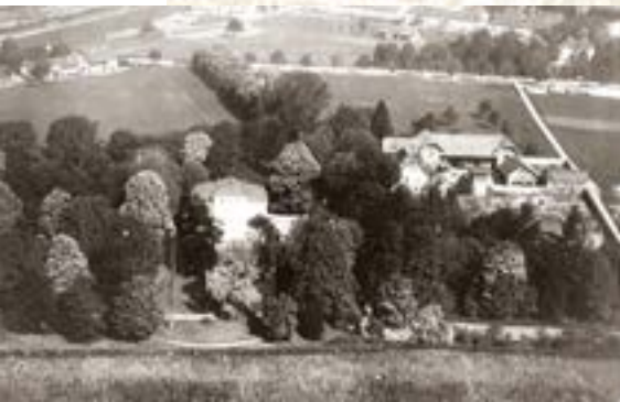
Die herrschaftlichen Gebäude des Landgutes Hirzbrunnengut