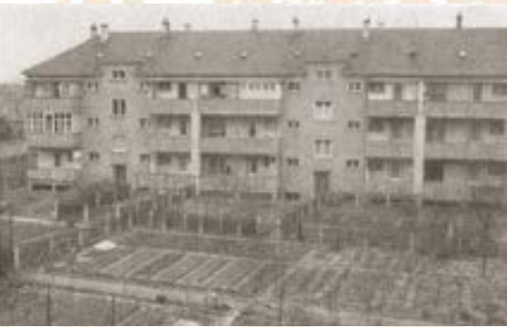
Ansicht Fassade mit Terrassen der Häuser hofseitig Richtung Hirzbrunnenstrasse, 1937