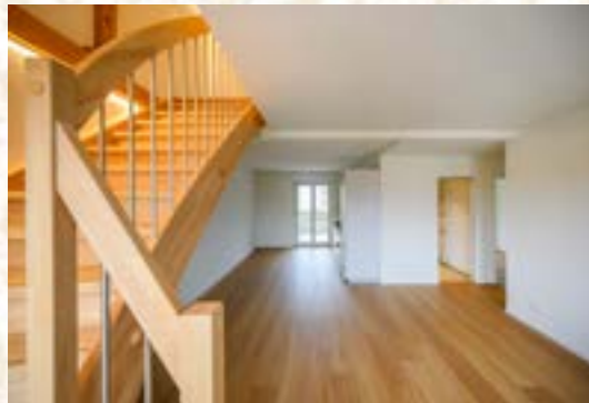
Treppenaufgang Maisonettewohnung Richtung Balkon, vorher und nachher