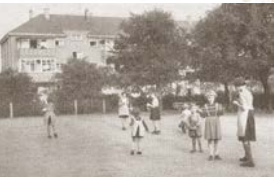
Spielplatz, Ansicht Fassade der Häuser hofseitig Richtung Hirzbrunnenstrasse, 1937