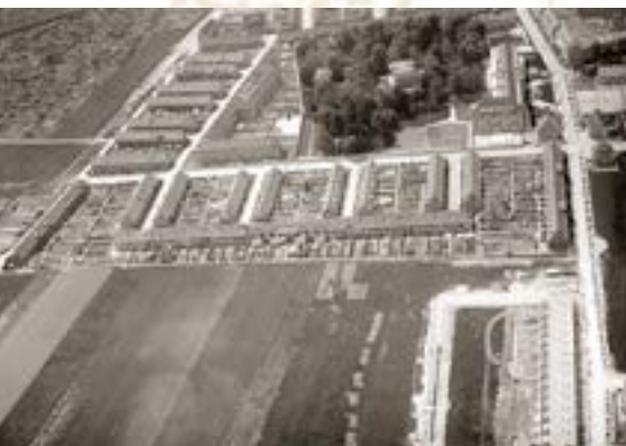
Claraspital mit Park und Villa, Hirzbrunnengut und Im Heimatland

In Basel stand das Hirzbrunnengut schon seit längerer Zeit zum Verkauf, da es nach dem Bau der Badischen Bahn nicht mehr als herrschaftliches Landgut betrachtet wurde. Der Besitzer Vischer-d'Assonleville gab zum Verkauf ein viermonatiges Optionsrecht, worauf eine Landgenossenschaft gegründet wurde.