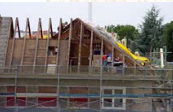
Dacharbeiten, Haus Im Heimat- land 11

Die Arbeiten sind am Ende zur vollen Zufriedenheit der Genossenschaft ausgeführt worden.