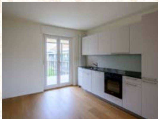
Wohnküche Maisonettewohnung mit Balkonzugang