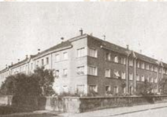
Ansicht Fassaden der Häuser strassenseitig Im Heimatland/Hirzbrunnenstrasse

merwohnungen, 25 Zweizimmerwohnungen, 36 Dreizimmerwohnungen und 9 Vierzimmerwohnungen.