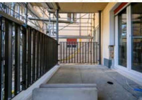
Vollendete Terrassenausgänge mit eingesetzten Fenstern und Balkonbrüstung

Bereits in der Vorprojektierung wurden Alterswohnungen thematisiert, welche ein altersgerechtes Wohnen erlauben und die Wohnungen mit einem Lift erschliessen. Weiter werden Wohnraumerweiterungen in Betracht gezogen, welche die bestehenden Wohnungen vergrössern und so wesentlich mehr Wohnkomfort generieren. Dies alles soll mit einem tragbaren finanziellen Aufwand umgesetzt werden, welcher von uns allen getragen werden kann. Frei werdende Wohnungen werden zurzeit nur noch mit einem Jahresmietvertrag vergeben, um so den Mietzinsausfall der Wohnungen aufzufangen und gleichzeitig das Wohnraumangebot für die eigenen Mieter im Falle eines internen Umzugs so gross wie möglich zu halten.