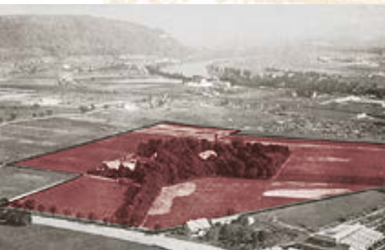
Das Hirzbrunnengut-areal vor der Überbauung, Juli 1924