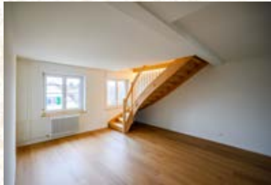
Treppenaufgang Maisonettewohnung, Blick vom Estrich in die zukünftige Wohnung