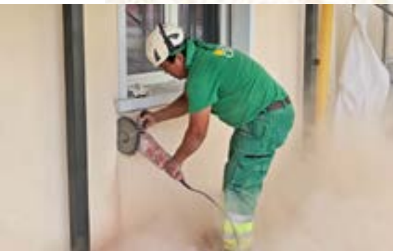
Fassadenschnitt Küchenfenster für Terrassenaus- gänge