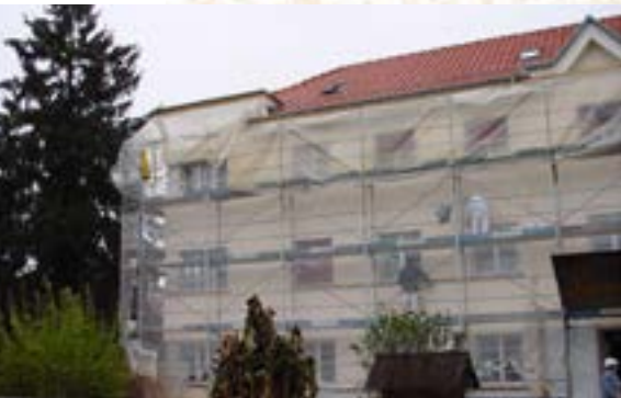
Renovation Fassade, Haus Hirzbrunnen- strasse 80